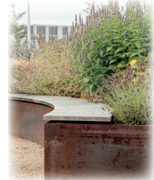
DUFTENDE BEETE Essbare Wildkräuterbeete in Corteenstahl eingefasst, entlang des Hauptweges (wassergeb. Wegedecke).