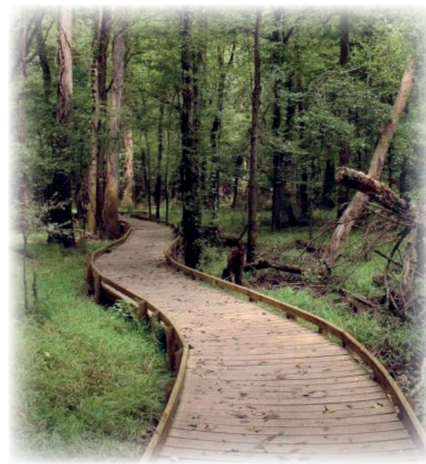
WILDNIS Auf abgelegenen Holzplateaus kann die Stadtwildnis des Geländes von innen beobachtet werden.