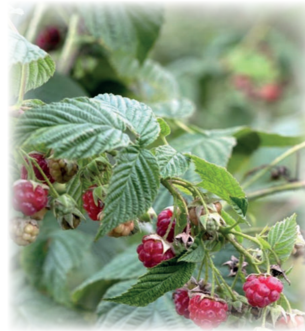
NASCHPFAD Beerensträucher und Obstbäume laden dazu ein, die essbare Vielfalt der Natur zu erkunden und zu schmecken