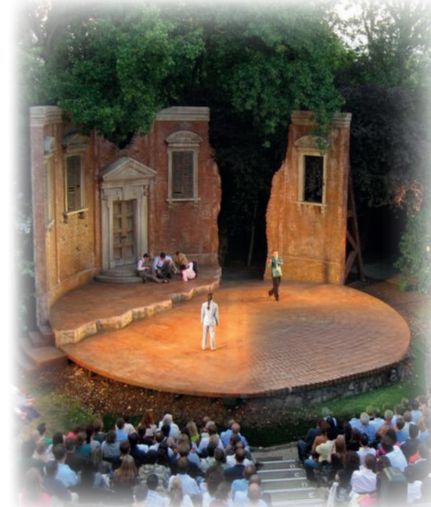
AUS ALT MACHT NEU Aus der alten Bestandsmauer wird eine neue Bühne geschaffen für Veranstaltungen wie Theater.