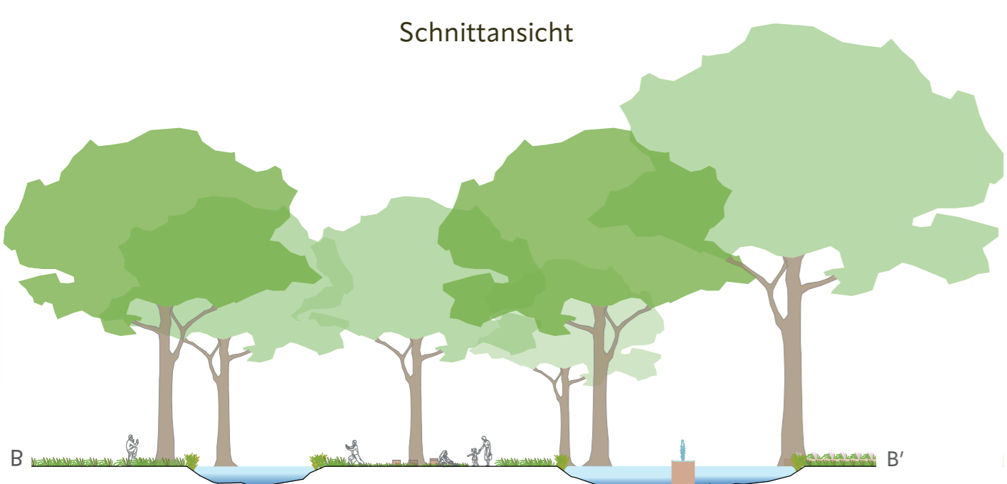
ERHOLUNGSINSELN Inmitten von der Spontanvegetation führen naturnahe Wege zu gemütlichen, freigemähten Rückzugsorten. Wasserbereiche fördern Biodiversität und erzeugen angenehme Geräusche.