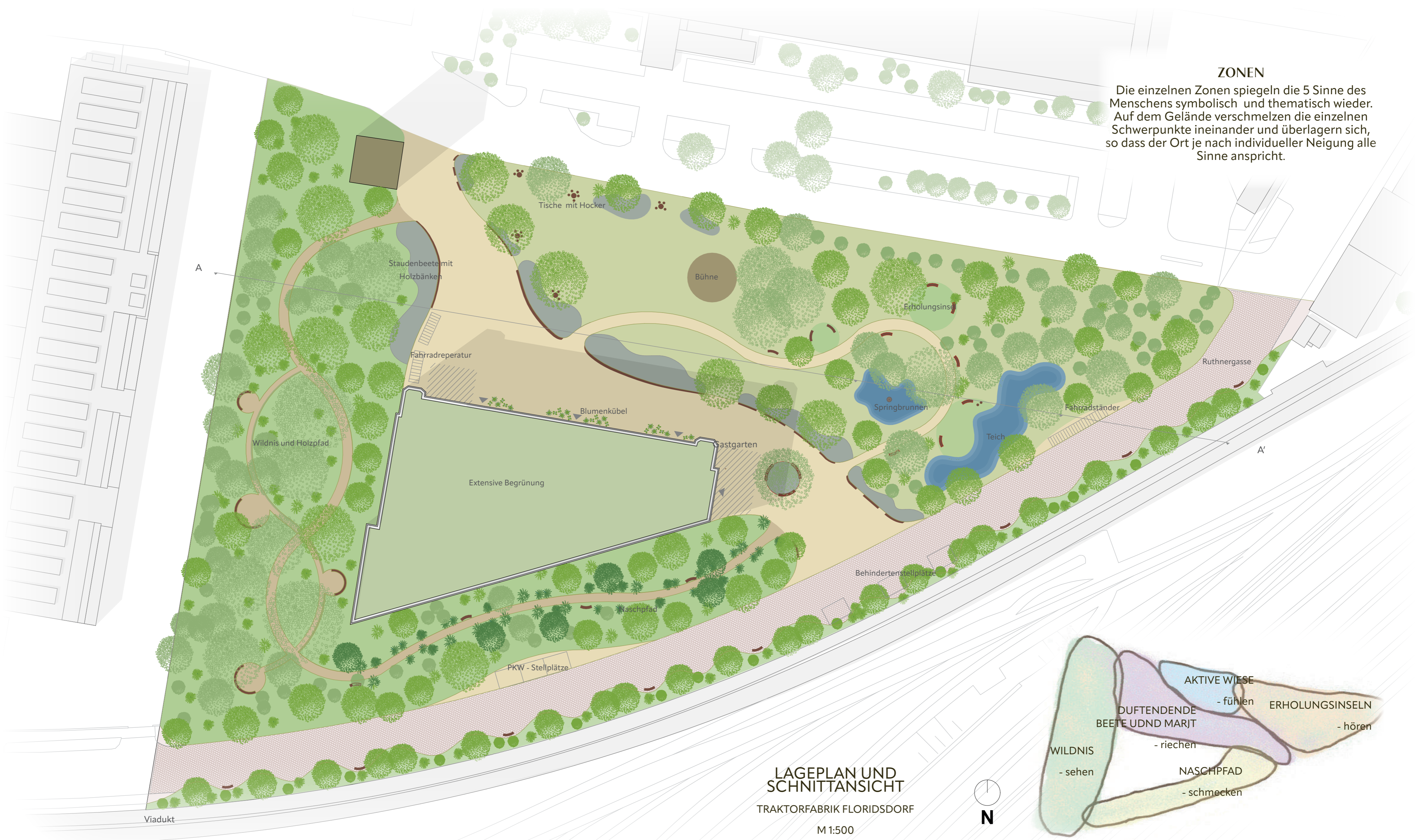
LAGEPLAN UND SCHNITTANSICHT TRAKTORFABRIK FLORIDSORF M 1:500

ZONEN Die einzelnen Zonen spiegeln die 5 Sinne des Menschen symbolisch und thematisch wieder. Auf dem Gelände verschmelzen die einzelnen Schwerpunkte ineinander und überlagern sich, so dass der Ort je nach individueller Neigung alle Sinne anspricht.