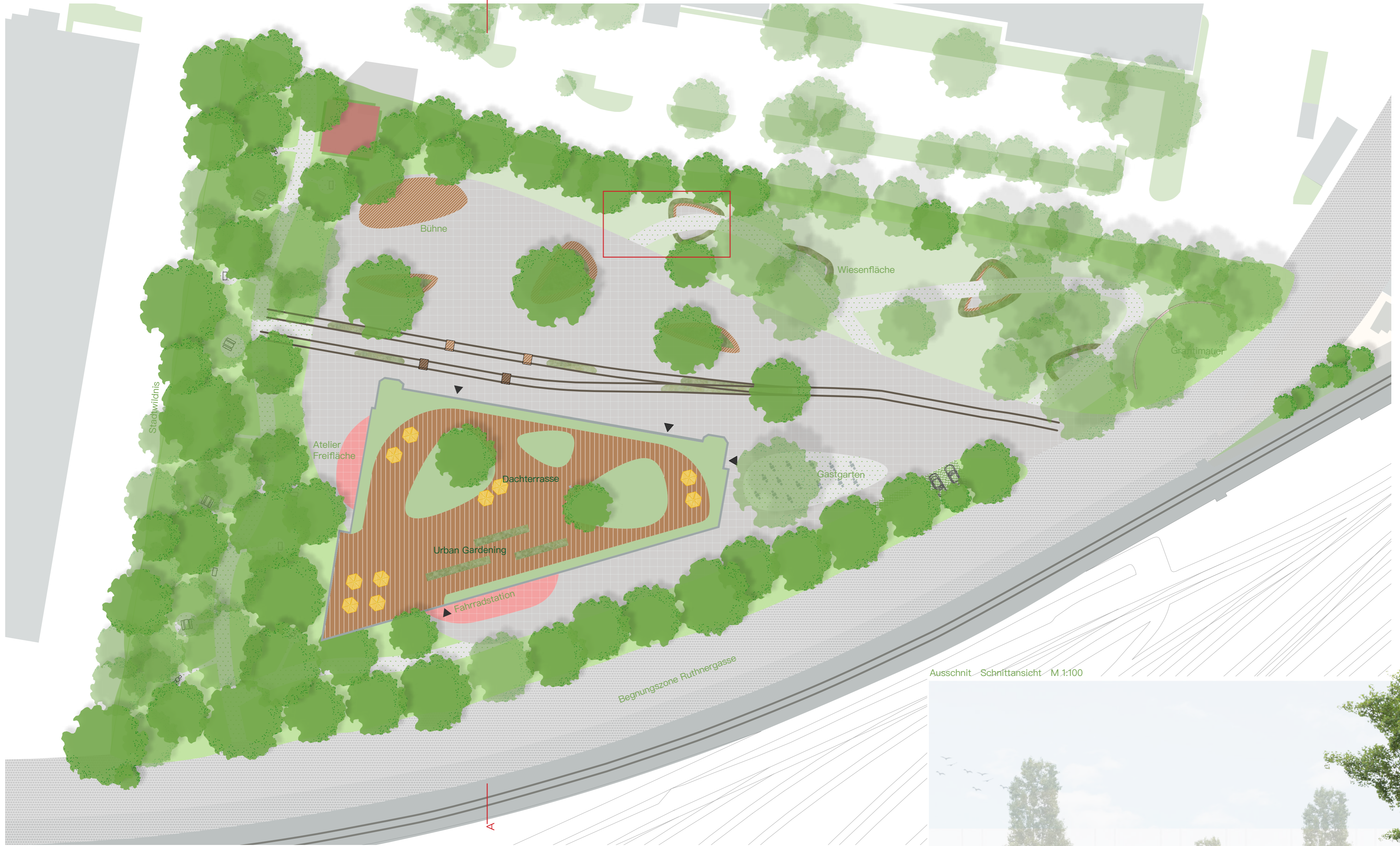
Ausschnitt - Schnittansicht - M 1:100