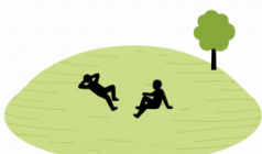
Piktogramm 2: Grashügel Grüner Rasen mit entspannten Figuren - ruhige Aufenthaltsfläche zum Verweilen