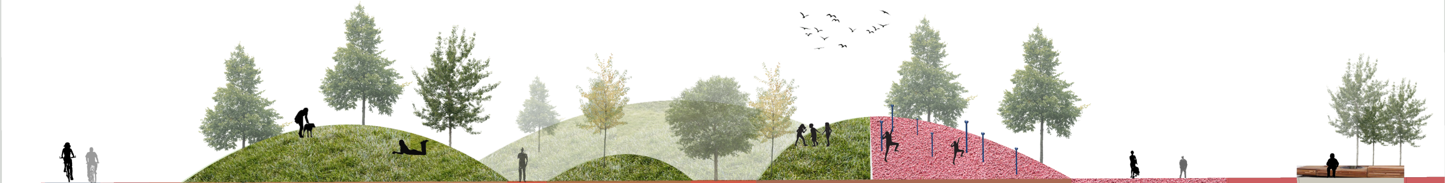
Schnittansicht M 1:200