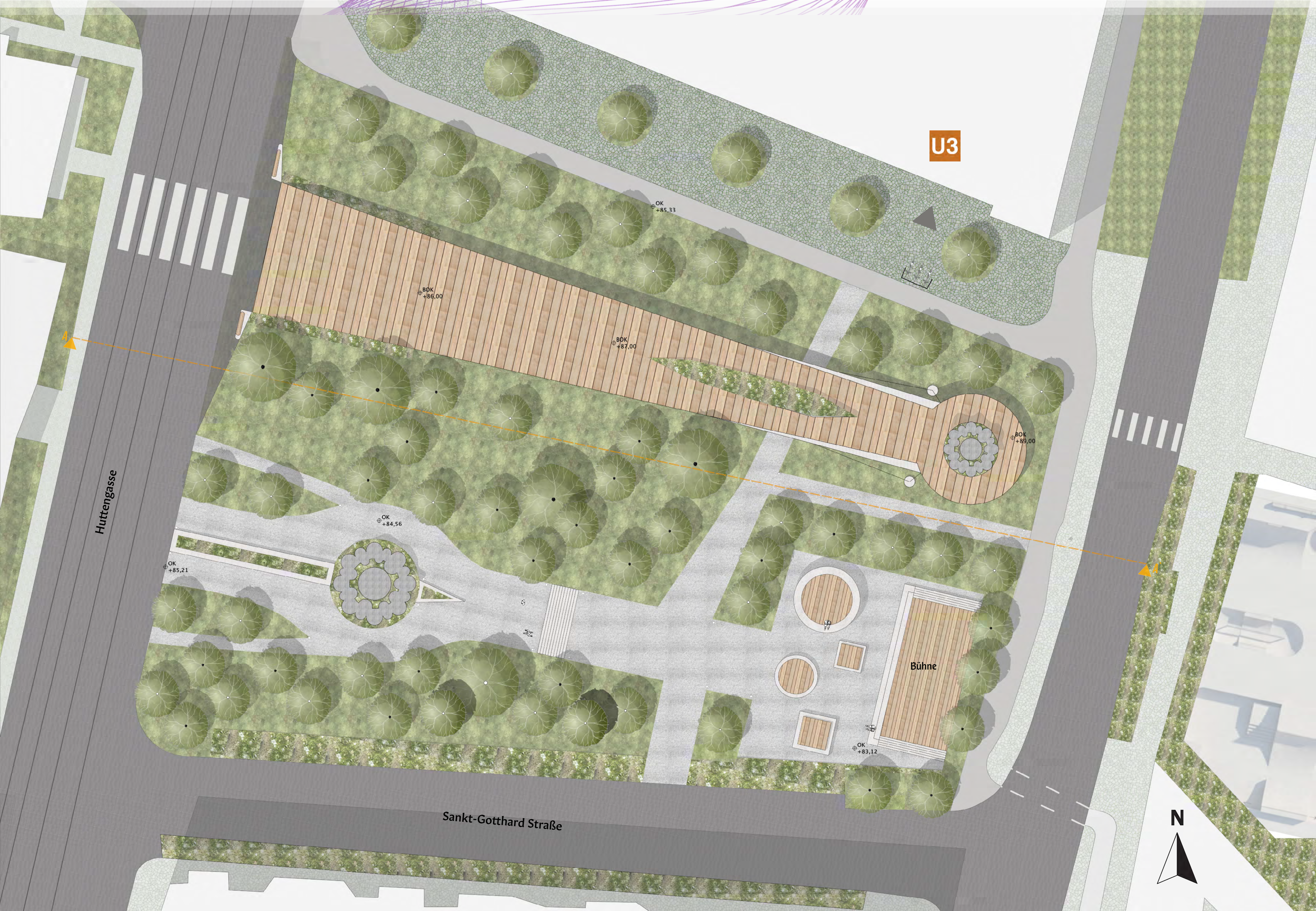
GRUNDRISS (MASSSTAB 1:200)