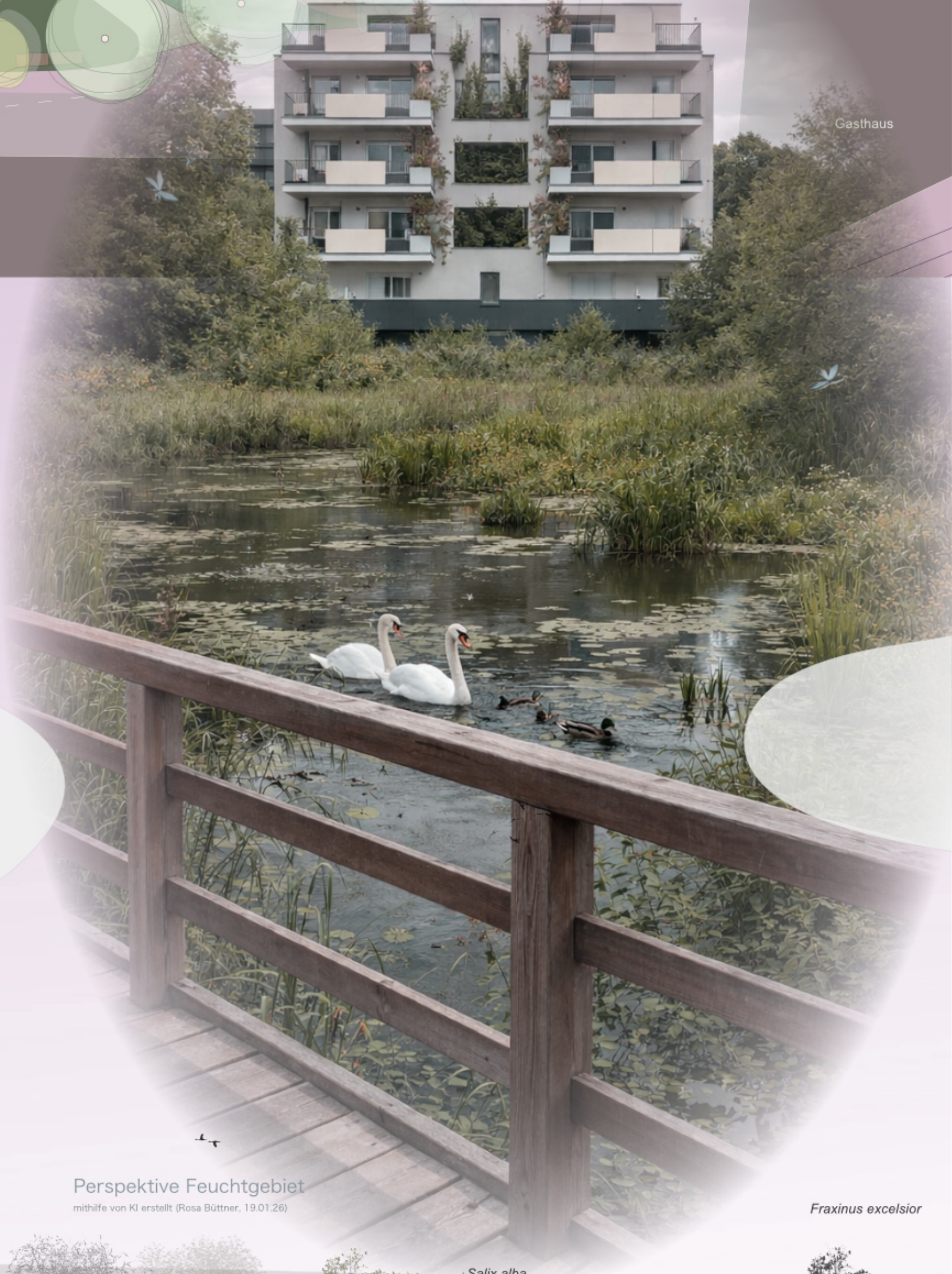
Perspektive Feuchtgebiet mithilfe von KI erstellt (Rosa Büttner, 19.01.26)