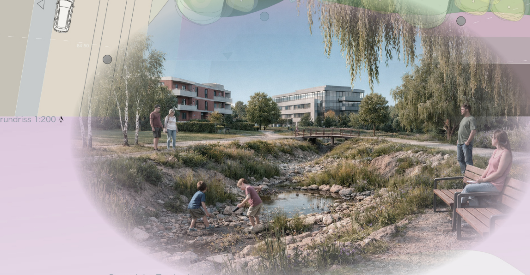
Perspektive Trockenbecken mithilfe von KI erstellt (Rosa Büttner, 19.01.26)