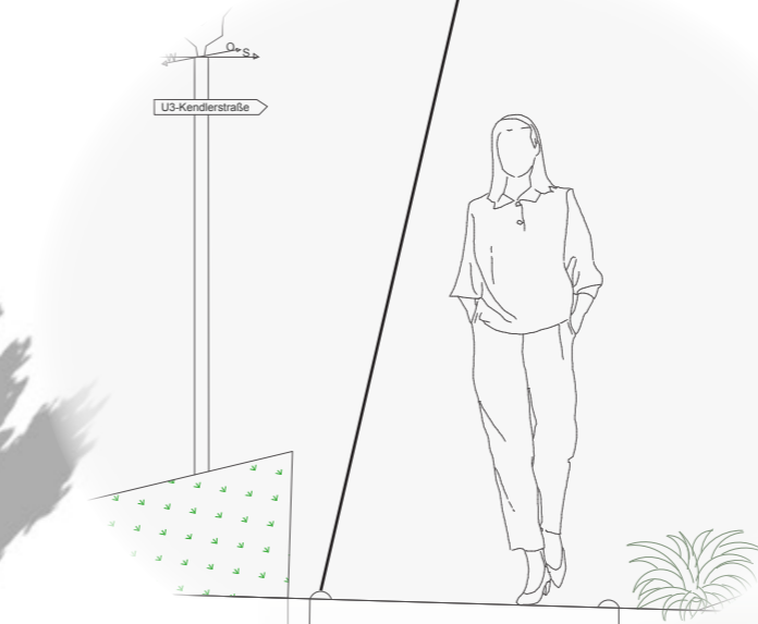
DETAIL: BEPFLANZT SCHORNSTEIN