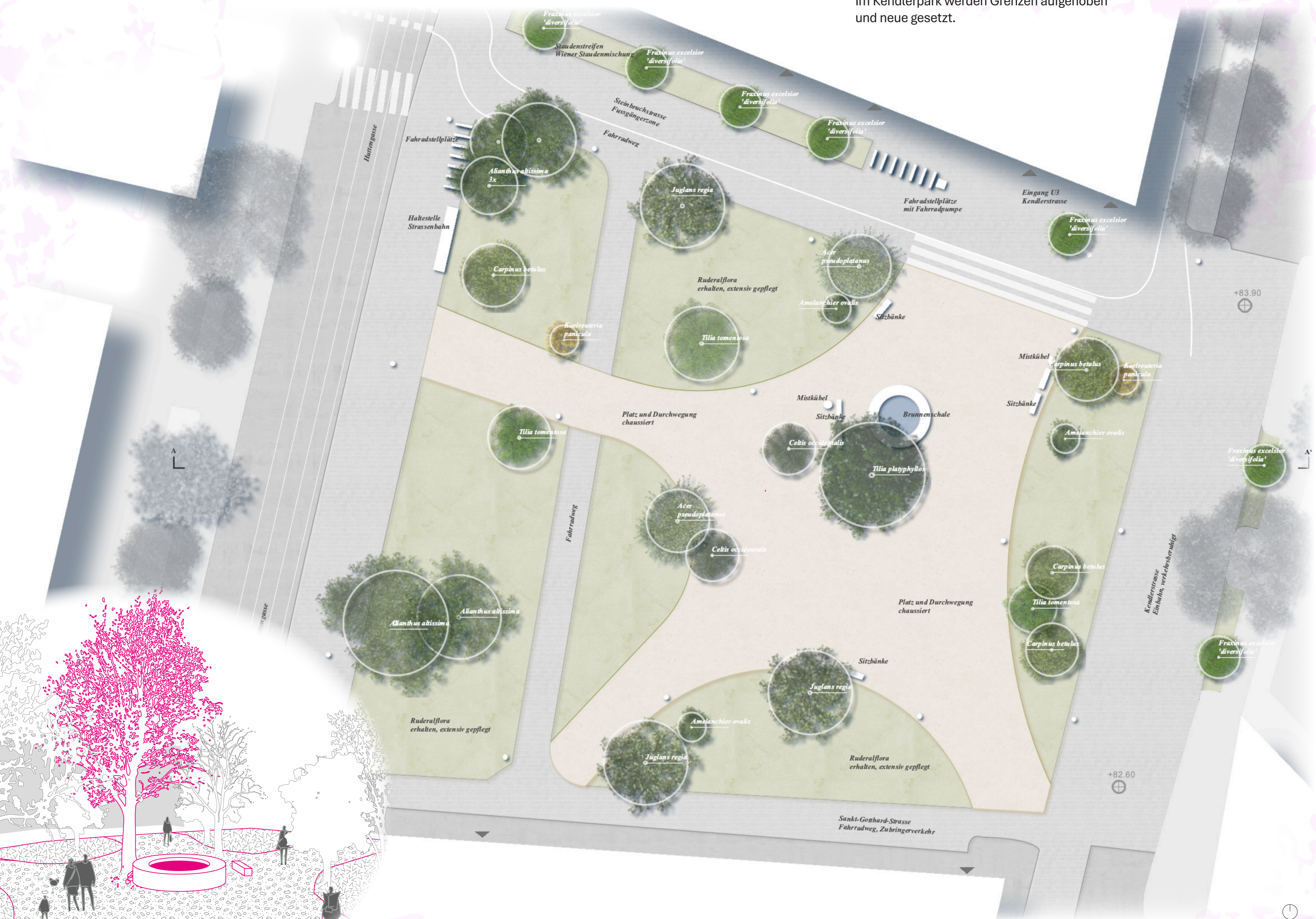
Perspektive auf den Dorfplatz mit Brunnen und Sitzbänken

Im Kendlerpark werden Grenzen aufgehoben und neue gesetzt.