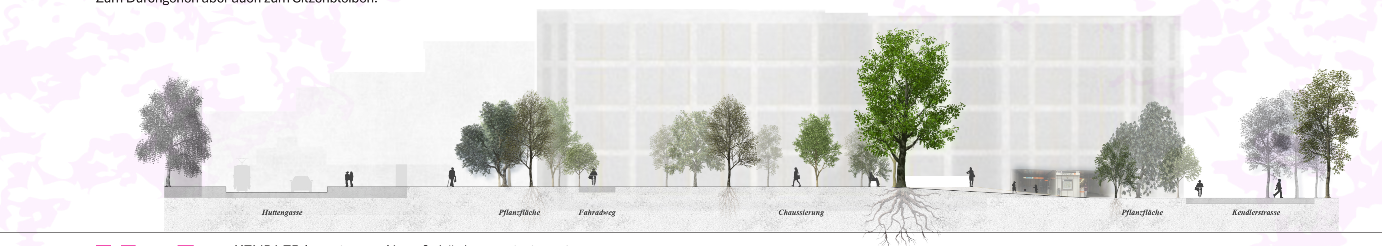
Schnittansicht A-A' M 1:200

Durch die chaussierung der Fusswege, den Erhalt und die differenzierte und extensive Pflege der bestehenden Ruderalflora sowie die Platzierung eines Brunnens und Sitzmöglichkeiten entsteht neben einer effektiven Wegführung auch ein nutzungsöffener Freiraum mit Dorfplatzatmosphäre. Zum Durchgehen aber auch zum Sitzenbleiben.