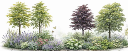
Gleditsie, Hopfenbuche, Blutbuche, Ulme