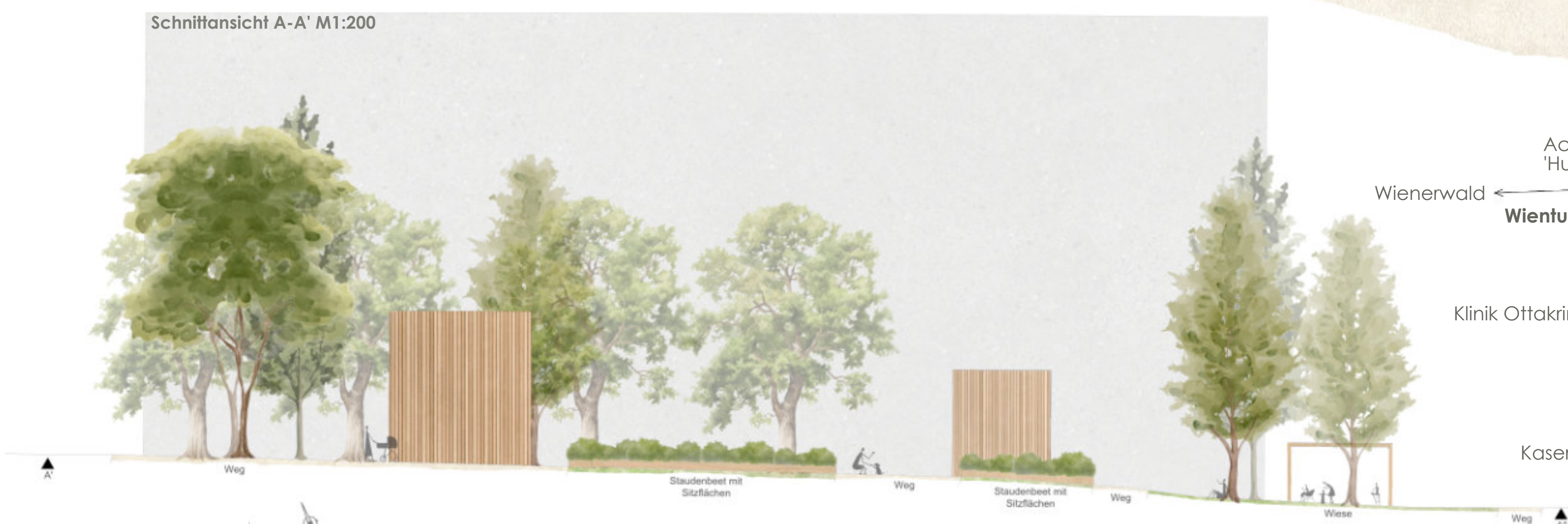
Schnittansicht A-A' M1:200