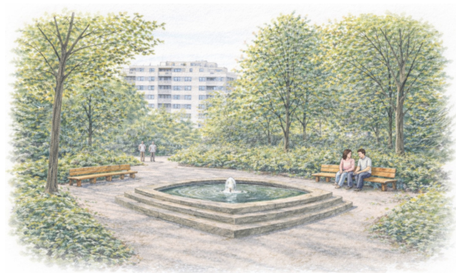
Perspektive, generiert und überarbeitet

23 Bäume - 19 Neupflanzungen - machen den Wienerwald im Stadtraum spürbar. Sie verbessern das Mikroklima, schaffen Aufenthaltsqualität und sorgen für eine bemerkbare Kühlung der Umgebung.