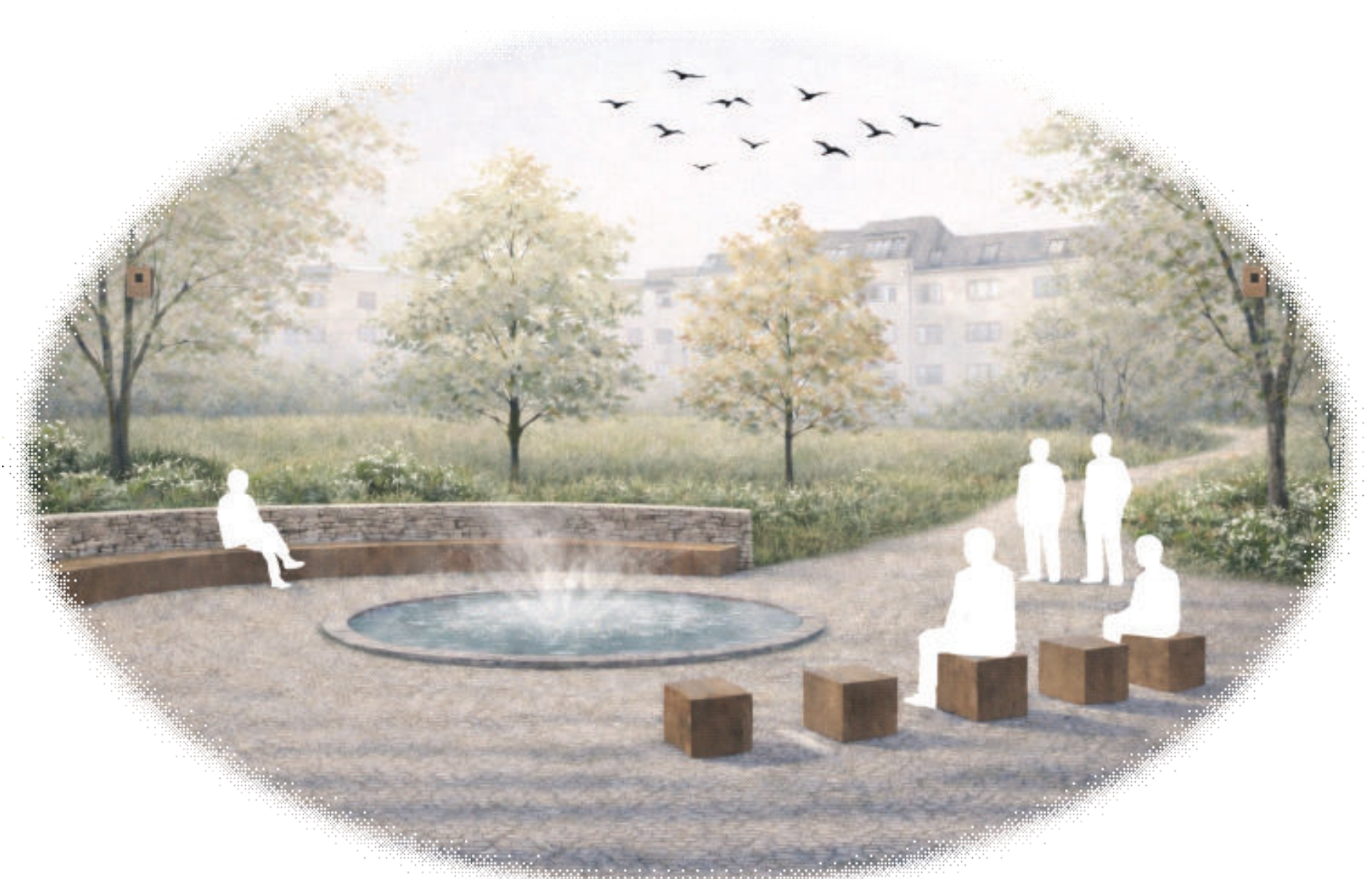
Perspektivische Darstellung des Entwurfs Blickrichtung von U-Bahn in den Park Darstellung: Eigene Entwurfsvisualisierung, erstellt mit Unterstützung eines KI-Tools (ChatGPT, OpenAI, 2026)

Der Entwurf bildet eine offene Parklichtung mit einer zentralen, bodenbündigen Wasserfläche als Aufenthaltsort. Geschwungene Wege orientieren sich an bestehenden Bewegungsströmen und erschließen den Park barrierefrei . Mobiles Mobiliar ermöglicht eine flexible Nutzung des Raums, etwa für Aufenthalt, Spiel oder temporäre Veranstaltungen wie Märkte. Vegetation , Wasser und Ausstattung sind so angeordnet, dass sich Nutzungen für Mensch und Vogel überlagern und ein vielseitig nutzbarer, klimaaktiver Freiraum entsteht.