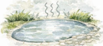
Klima & Wasser