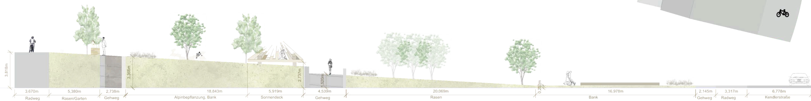
Schnittansicht M 1:200