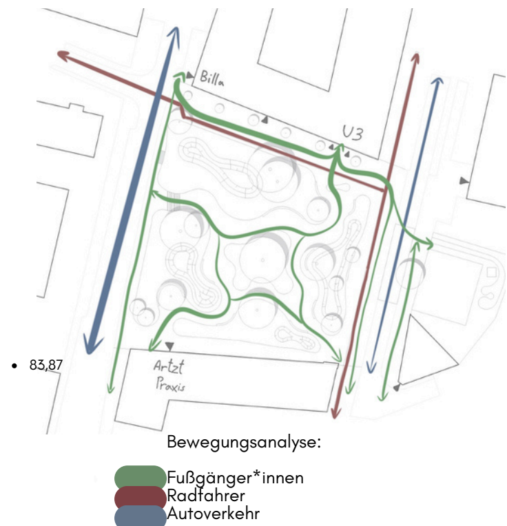
Bewegungsanalyse: Fußgänger*innen Radfahrer Autoverkehr