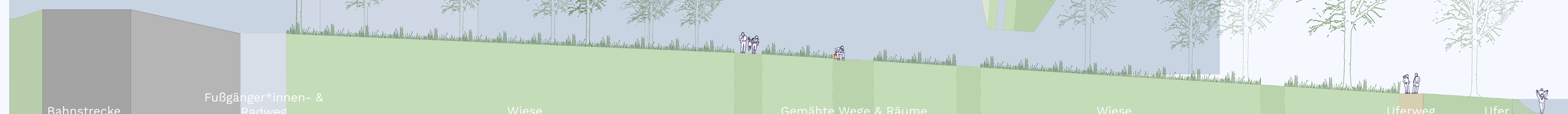
Schnitt A-A' M 1:250