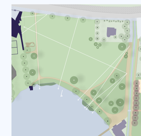
Sichtachsen M 1:3300