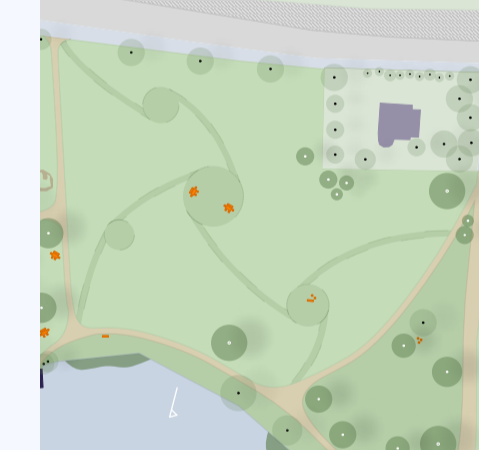
Mögliche Mähoptionen M 1:2500