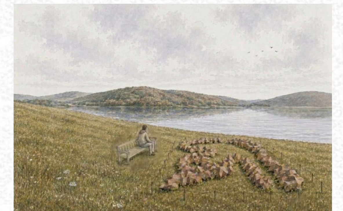
Perspektive Hügel – Kärnten Relief

Ein großzügiger, frei zugänglicher Uferbereich stärkt die Verbindung zum See und bietet gemeinsam mit den weitläufigen Liegeflächen Raum für Erholung, Begegnung und Naturgenuss. Die verlängerte Wegeachse verbindet die frei zugänglichen Uferbereiche miteinander und führt Besucherinnen und Besucher entlang des Wassers. Eine begehbare Plattform im See sowie ein kleiner Rundwandersteg erweitern das Freizeitangebot und ermöglichen besondere Natur- und Wassererlebnisse.